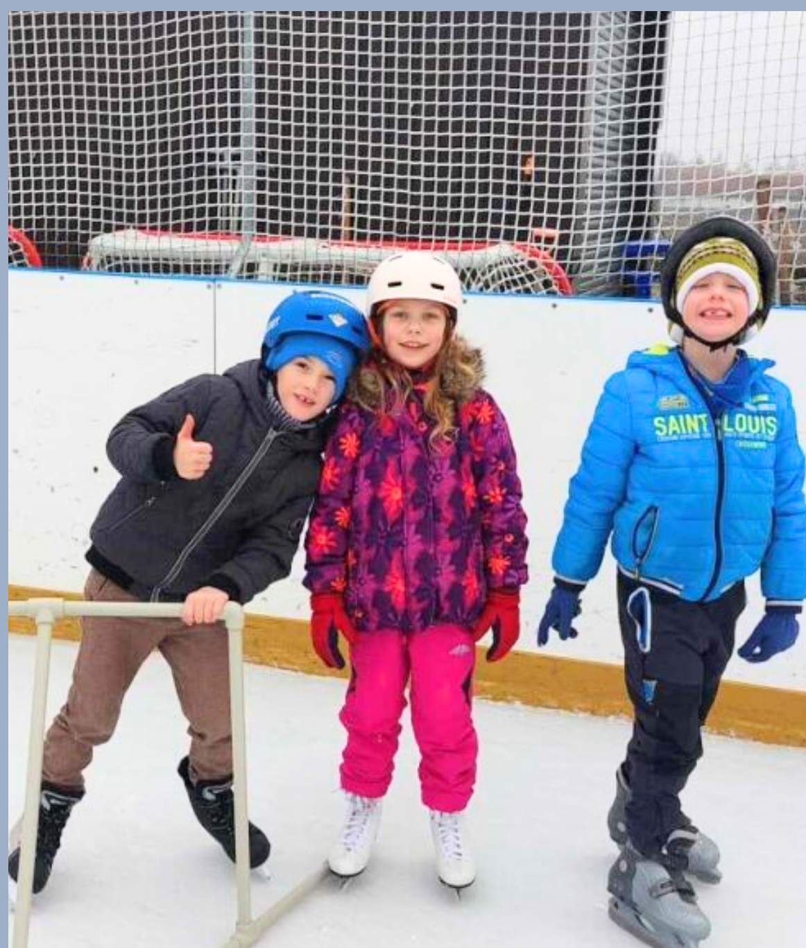
Bruslení v hodinách TV