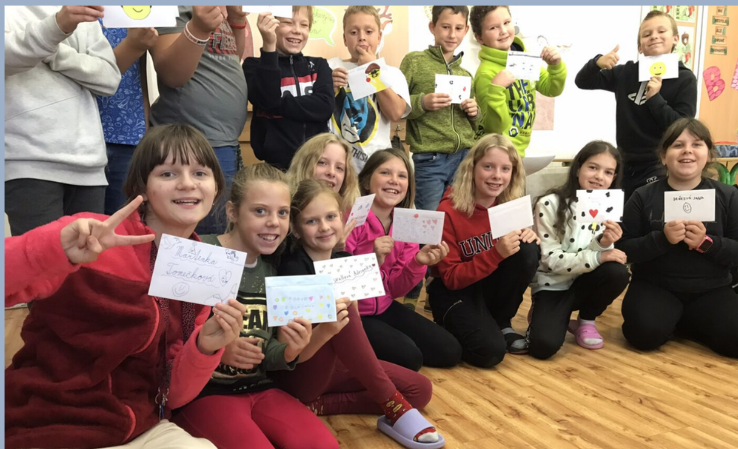
Dopisování s přátelskou školou ZŠ Žandov