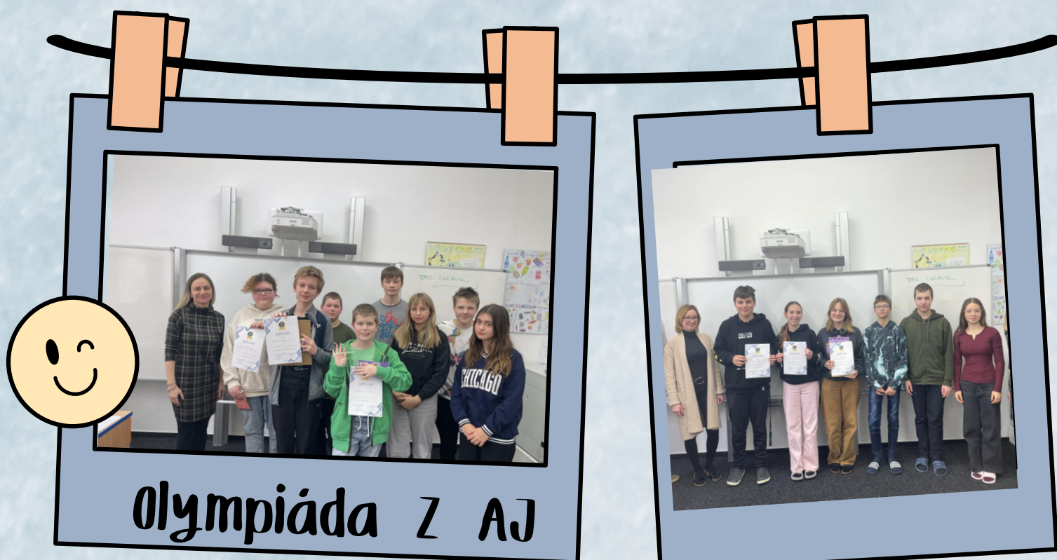
Olympiáda Z AJ