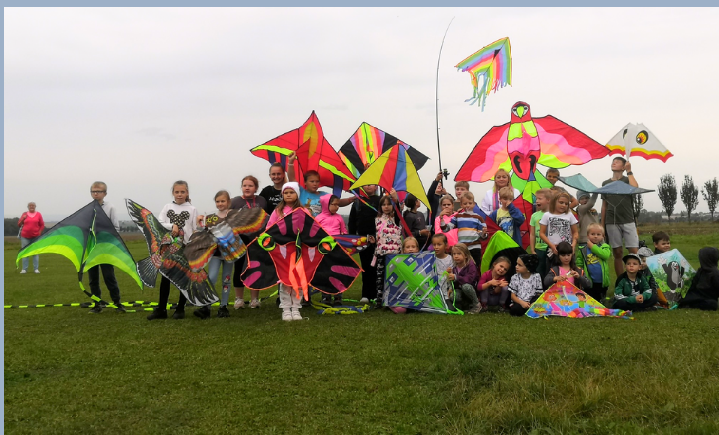
Drakiáda ve školní družině