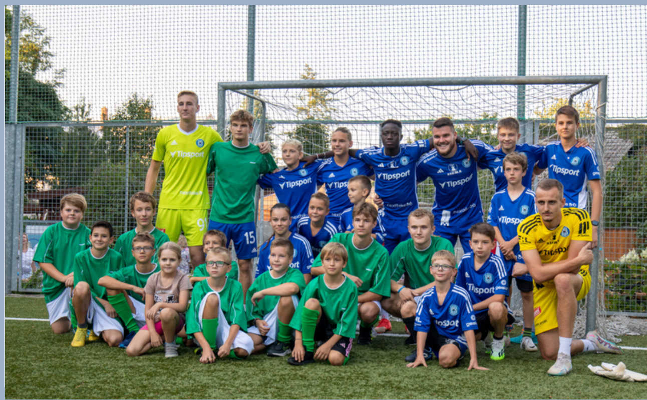
Sportovní zahájení školního roku 2023/2024

Opět jsme byli svědky fotbalového utkání SK Sigma Olomouc vs. žáci naší školy , ve kterém vítězové získali unikátní sladkou odměnu - dort.