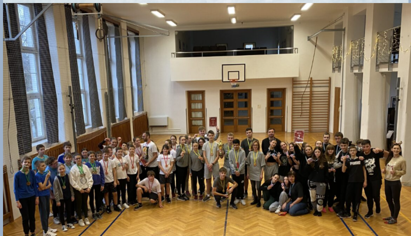
Vánoční sportovní turnaj